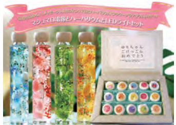
マシュマロ電報と ハーパリウム