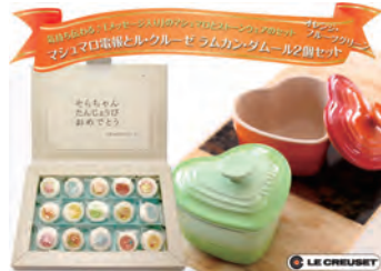
マシュマロ電報とル・クルーゼ ラムカン・ダムールセット