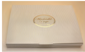
マシュマロ電報パッケージ