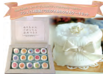
マシュマロ電報と 今治タオルケーキセット